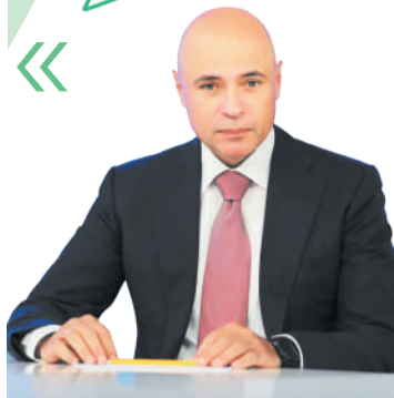
Игорь Артамонов, губернатор Липецкой области:

— Мы сильная, суверенная страна, способная обеспечить собственную безопасность во всех сферах — от продовольственной до информационной. Национальные проекты — это стратегические инструменты для укрепления наших позиций. Липецкой области удаётся успешно справляться с задачами, которые ставит перед нами президент в рамках национальных проектов. Для 17 тысяч многодетных семей в регионе действует более 40 мер поддержки, а благодаря нацпроекту «Семья» появятся новые. Очень своевременный проект для Липецкой области — «Кадры». Будем участвовать в новом национальном проекте «Технологическое обеспечение продовольственной безопасности». И это лишь часть примеров. Впереди много работы.