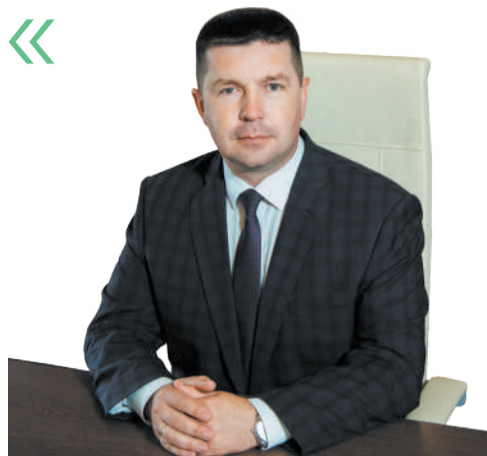
Роман Ченцов , глава города Липецка:

— Подводить итоги — приятная предновогодняя традиция. Мы многому научились, многое сделали. Город очевидно меняется к лучшему. Преображаются улицы, обновляются школы, поликлиники, спортивные объекты, общественные пространства. Все важные процессы совершаются лишь с одной целью — чтобы жизнь липчан стала комфортнее, краше, безопаснее. И мы, администрация города Липецка, формируем план работы всегда исходя из пожеланий горожан. Поэтому мне так важна обратная связь, живой диалог. В преддверии нового, 2025 года — 20 декабря в 15:00 — в Центре управления регионом пройдёт прямой эфир. И мы с вами не только подведём итоги, но и поговорим о планах на будущее. Чтобы развиваться дальше.